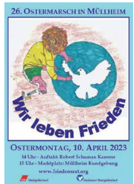
Ostermontag ist Ostermarschtag