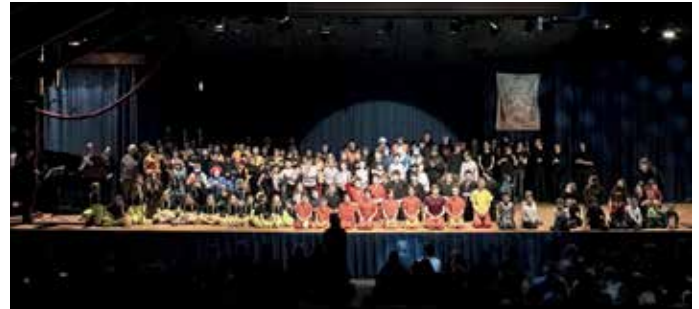
Die Schulgemeinschaft der Albert-Julius-Sievert-Schule Müllheim beim großen Finale ihrer Zirkusprojektwoche.

Aber nach dem Zirkus ist vor dem Zirkus – in vier Jahren soll es wieder heißen „Manege frei – Vorhang auf – Applaus! Applaus!“ Ein herzliches Dankeschön auch an alle Sponsoren, die dieses Projekt gefördert und somit realisiert haben: Bücher helfen e.V., Hilfsfond Kiwanis Neuenburg, Rotary Hilfswerk Müllheim-Badenweiler, Auma Riester GmbH Müllheim, Hilfswerk des Lions Club Müllheim-Neuenburg, Neoperl GmbH Müllheim, Volksbank Breisgau-Markgräferland, Spardalimpuls, Stadtwerke Müllheim Staufen GmbH, Sport Schmitt Müllheim.